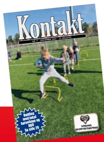
Forsidefoto: Boldleg med lokal børnehave "Vindmøllen" - se side 29

Modtager du ikke Kontakt så send en sms til Jens Rindom på 2024 2699