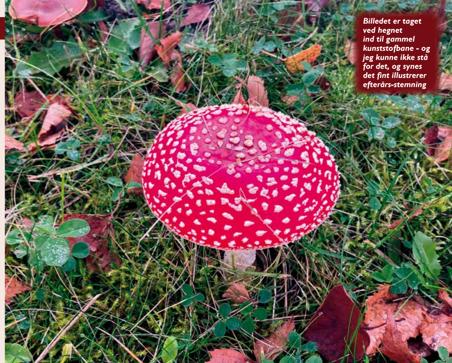
Billedet er taget ved hegnet ind til gammel kunststofbane - og jeg kunne ikke stå for det, og synes det fint illustrerer efterårs-stemming

Alt i alt en dejlig formiddag på vores gode anlæg og med masser af godt tennisspil - men som nævnt indledningsvist håber vi på et større fremmøde næste år. ■