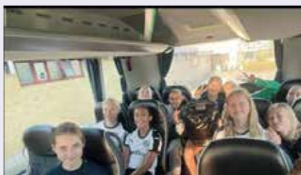
Der var fælleskørsel til Snejbjerg