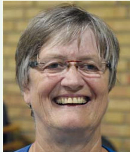
Der bliver altid grinnet meget til gymnastikken...