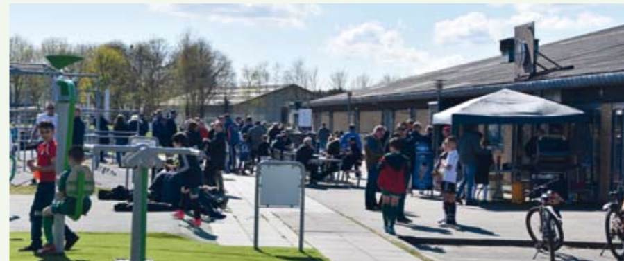
- mange mennesker