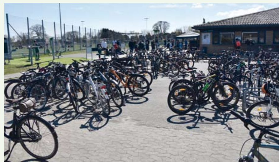
og mange cykler