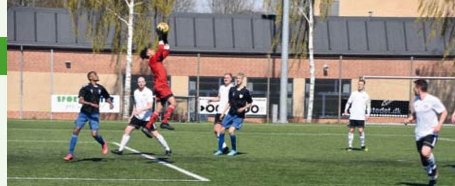
Store hjemmekampsdag den 23. april