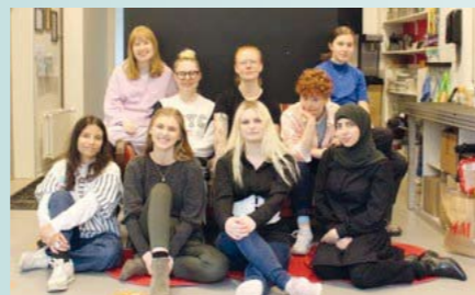
Det her er mit nuværende hold på Vejle Musik- og Kulturskole