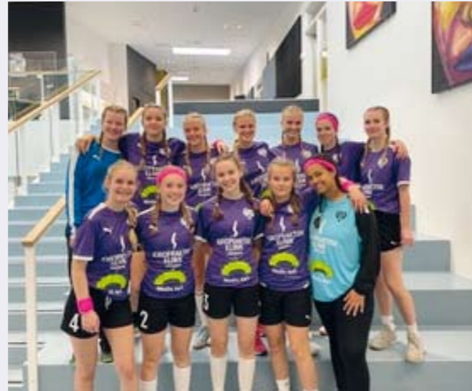
den 17.-19.september. Det var et rigtigt godt stævne med nederlag og sejre og masser af god energi. ■

Som sagt deltog vi med 10 hold til Snejbjerg cup fra