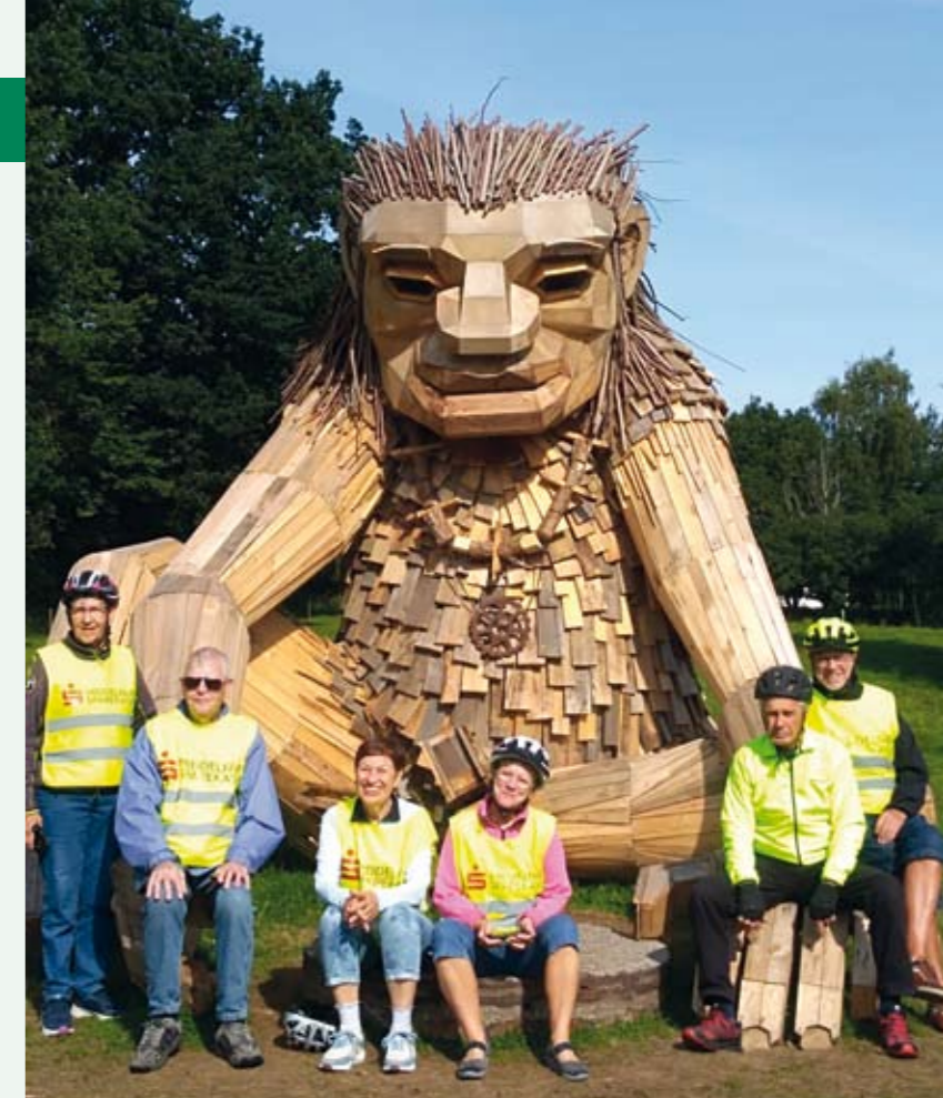
Cykel-holder holder et fortjent hvil ved trolden i Børkop.